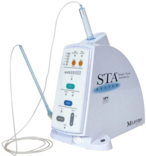
Anestesia Computarizada “The Wand”