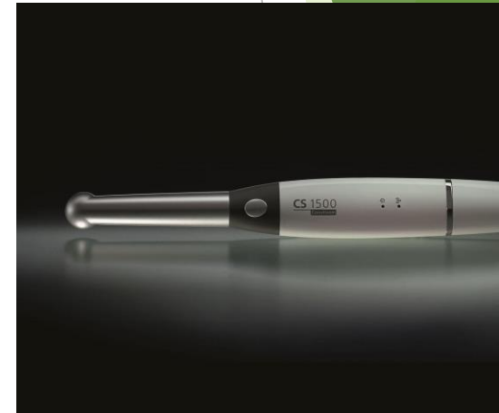
Cámaras HD Carestream Para Diagnósticos